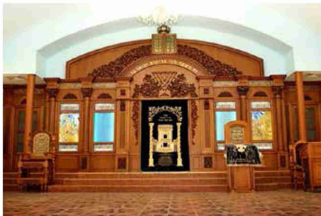
עשרת הדיברות. לחוות מחדש (בצילום: ארון הקודש בחרסון, אוקראינה)