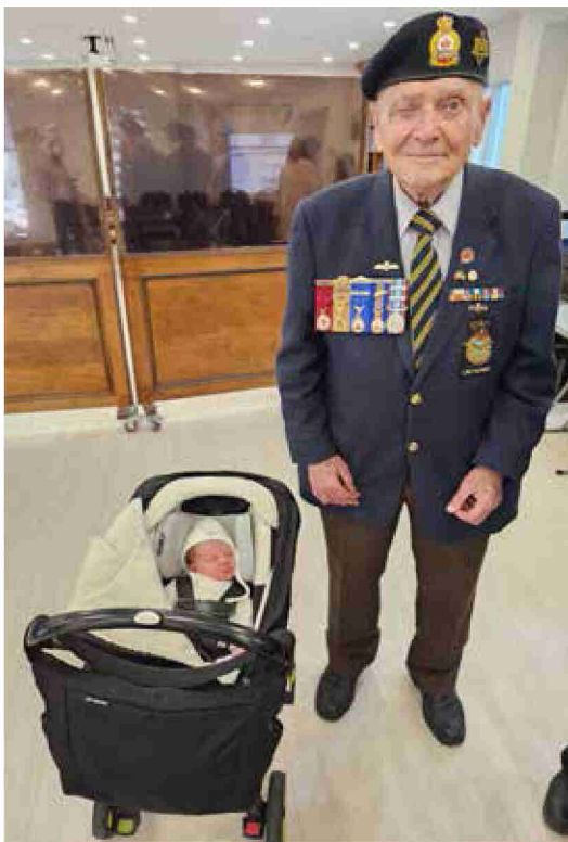
בית הדורות. נכנסו יחדיו בביתו של אברהם אבינו