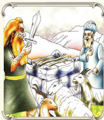
יעקב לא נבהל מעשו, אלא פעל בדרכים נכונות כדי לקנות קרבת אלקים על ידי פגישתו עם עשו...

כמו שאמר יעקב, "כי במקלי עברתי את הירדן והנה ועתה הייתי לשני מחנות" - תפרט את כל הטוב שיש לה, משפחה, חברים, שאתה יהודי ומשתדל לעשות רצון ה', שלא נטעה לשקע בדברים רגועים וחולפים אלא נתבונן בחיי עולם, בעולמות של טוב שיהיה לכל אחד ואחד לעולם הבא. תמיד יש לאדם קשיים ונסיונות ועד שנגמר נסיון אחד מגיע נסיון שני, לפעמים אדם מצפה למצא את