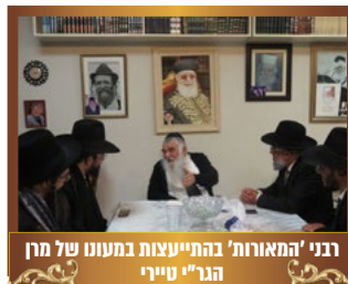
רבני 'המאורות' בהתייעצות במענו של מן הגר"י טיייר

אחדות בין כלל קהילות ק"ק תימן, רבני קהילות, הגבאים וכלל חברי קהילתם, בכח האחדות תיעזר קהילה אחת