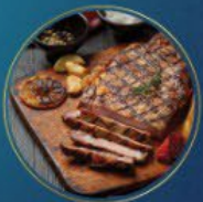
ארוחת שף עשירה

שנחוג כמידי שנה ברוב פאר והדר על ידי מוסדות התורה והחסד 'מאורות הרש"ש' וארגון 'המאורות' - המרכז הארצי ליהדות תימן -