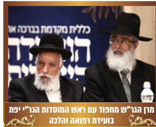
מן הגר"ש מחפוד עם ראש המוסדות הגר"י יפת בוועידת רפואה והלכה