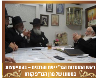
ראש המוסדות הגר"י יפת והרבנים - בהתייעצות במענו של מן הגר"פ קורח

חשוב לחדד כי יוזמה גדולה, רחבה וגדולה שכזו הינה דורשת מערך אסטרטגי רחב היקף, וחשיבה רבת גוונים הדורשת מאמץ ועיון פרטני ודקדקני לצרכי הקהילות בארץ הקודש, אך מאידך נדרשת שותפות מלאה מצד גבאי קהילות עם איגוד הקהילות, ובכך נתלכד כגוף גדול וחזק המייצג את סלתה ושמנה של בני התורה מעדת תימן בארץ הקודש, או אז - נוכל לגשת אל עסקני הציבור ככח פורח ועולה ובס"ד נקבל את המענה כיאות וכנדרש.