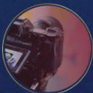
הפקת מולטימדיה מרגשת