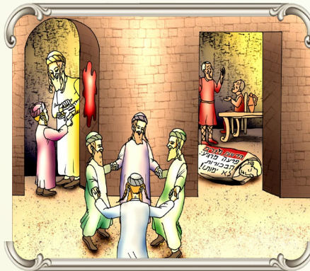
עשרת המכות בעקמם, לא נועדו בשביל המצרים כי אם לכלל ישראל שיתבוננו בגדלת ה'

ולדבר אודות אהבת ה' אלינו ועל כך שהוא נותן לנו כל טוב. וזה שנצטוונו לא להסיח דעת מהתפליו, אלא שנזכר את ה' בעת שאנו מניחים תפליו, וזה גם ענין מצות מזוזה כמו שכתב הרמב"ם בהלכות מזוזה וזה לשונו "חייב אדם להזהר במזוזה מפני שהיא חובת הכל תמיד. וכל זמן שיכנס ויצא יפגע ביחוד השם שמו של הקדוש ברוך הוא, ויזכר אהבתו ויעור משנתו ושגיותיו בהבלי הזמן. וידע שאין דבר העומד לעולם ולעולמי עולמים אלא ידיעת צור העולם. ומיד הוא חוזר לדעתו והולך בדרך מישרים. אמרו חכמים הראשונים כל מי שיש לו תפליו בראשו ובזרועו, וציצית בבגדו ומזוזה בפתחו מחזק הוא שלא יחטא שהרי יש לו מזכירין רבים..." וכאשר נזכר על ידי המצוות, לא נצטרך תזכורות כואבות רח"ל.