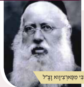
הרבי מפארציווא זצ"ל