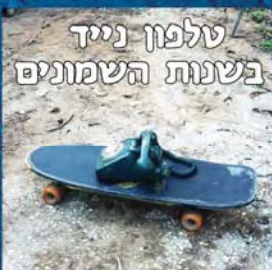
טלפון נייד בשנות השמונים

אף אחד לא באמת יודע איך מתייבשת הנקודה בה האטב מחזיק את הבגד.