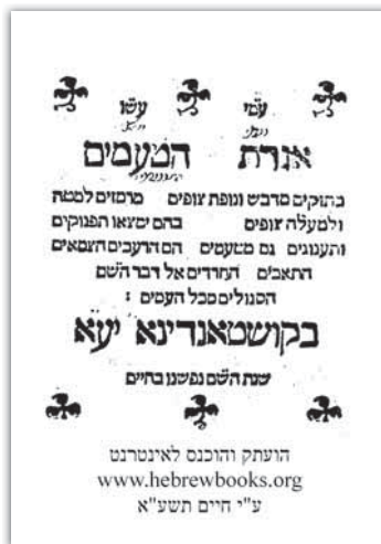
שער הספר דפוס מנטובה שמ"ב

סימתי זאת הקדשה, אכן הראשה לנו למורשה, ביום ראשון חרושה, ונתחנן בעת הזאת אל ה' לעזרתנו חושה. על פו, על כל דברי האגרת הזאת, אני אומר כי היא אוגרת בקיץ לחמה, ומזון הנפש שהוא המאכל האמתי, צידה לדרך הידוע, כי זה כל האדם. ויקים בנו מקרא שכתוב (ישעיה סה טו): "אשר המתברך בארץ יתברך באלקי אמן", עצמה רבה לאין אונים, בשכר זה: 'ויבא גוי צדיק שמר אמנים' (ישעיה כו ב), "ה' אלקי אתה ארומקף אודה שמך כי עשית פלא עצות מרחק אמונה אמן" (שם כ א).