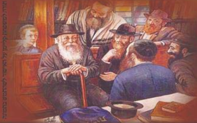
תורה למשפחה קיימת על האישור לפרשת שבוע