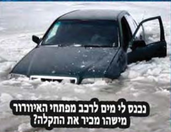
נכנס לי מים לרכב מפתחי האיוורור מישהו מכיר את התקלה?

אמרתי עוד 5 דקות אני מגיע, מה אתה מתקשר כל רבע שעה?