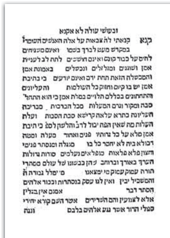
עמוד מתוך מאמר 'קנא קנאתי לה' בסוף ספר 'אגרת הטעמים'