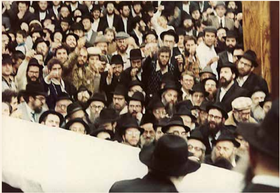
רבים מהם חזרו בתשובה שלמה והקימו משפחות חסידיות לתפארת. חברי קבוצת הסטודנטים מברזיל מניפים לעברו של הרבי כוסות 'לחיים' בעיצומה של התעודות 'שבת

"אחד הדברים שדרבן מאוד את הבאת הקבוצות הוא התבטאות מיוחדת מהרבי בנושא זה. לקראת י" שבט של אותה שנה (תשמ"מ), החלטנו לתרגם את הקובץ 'אמונה ומדע', המכיל אגרות של הרבי בנושאי השקפה המבארות בעיקר שאין כל סתירה בין האמונה היהודית לבין המדע. אני טרם שלטתי היטב בפורטוגזית, ומלאכת