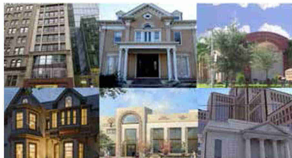
בתי חב"ד מפוארים ומושכי קהל. הכוח העולה ביהדות ארה"ב

ירידה חדה בהזדהות של יהודי ארה"ב עם התנועות הרפורמיות והקונסרבטיביות, בעוד היהדות האורתודוקסית נתונה בגידול מואץ