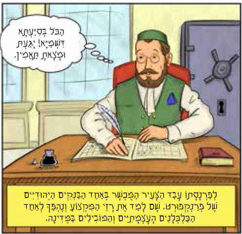
הפשוט יבוא א"ה