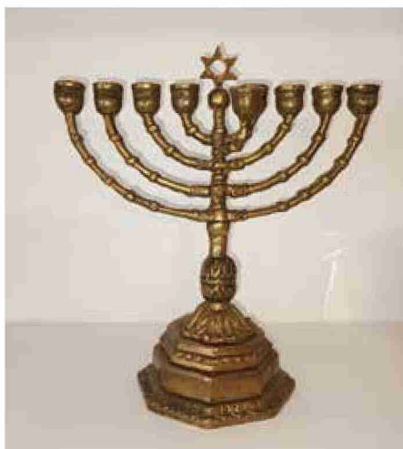
חנוכייה מוצלת מאש. הדוד גנב, האחין השיב