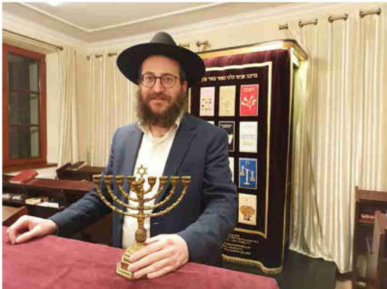
"נדליק את החנוכייה בבית הכנסת שבו נגנבה". הרב חיטריק

בסיום מכתבו כותב האיש כי היה שמח "אם החנוכייה הזו וסיפוריה יתקבלו כאות של שלום ופיוס", והוסיף: "אני מאחל לך ולקהילתך בנירנברג שלום וברכות".