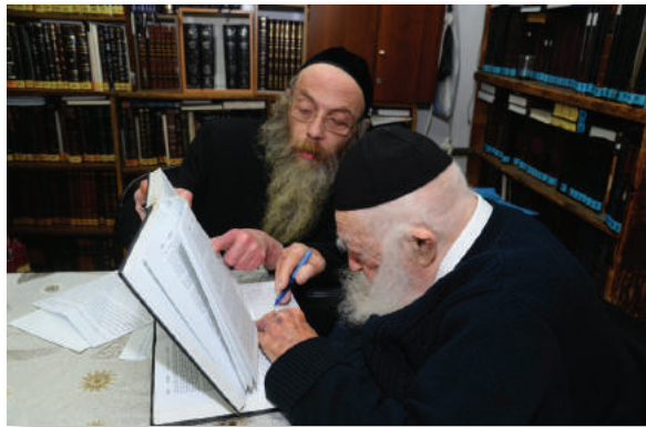
לאחר מאה ועשרים שנותי, יתחיל העולם להעריך... רבינו בערוב ימיו מתקן מילה בודדת בספרו 'שונו הלכות' ה'ל סוכה

בכלל, ספריו שחיבר היוו לגבי עולם בפני- עצמו, עולם בתוך עולם. בכל רגע נתון היו שרעפיו תפוסים היכן ניתן להוסיף והיכן יש לתקן הלשון, מה צריך להגיה, ובאיזה מקום יש לעיין את הענין מחדש. אין ספור פעמים כשבאתי לשבות בשבת בצל קדשו, הר שה"שלוש עליכם" או היה "אה! טוב שבאת, אני צריך אותך", או "רציני להראות לך משהו", סתם ולא פירש בשבת, אך רגע כמימרא לאחר בהמ"ז ב"מלווה מלכה", כבר היה תחוב בידו הדרך-אמונה או הנחל איתן וכיו"ב, והראה "כאן יש להגיה בלשון כך וכך", ו"כאן כדאי להשמיט מילה פלונית ובמקומה