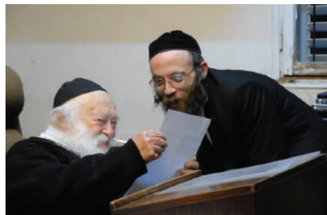
היה בבחינת "עוז וחדוה במקומו". הרב עם אחד מסמכתי התערות המשך בעמוד 2

כן בקודש חזיתי, פעמים רבות אין ספור, למעלה