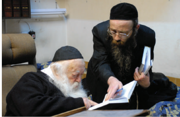
"מסתמא כשהייתי שקוע בהאי ענייני יצא לי שבדוקא כך צריך לכתוב". מעיין בסטמא דקראי יחד עם הגרמ"ש שליט"א