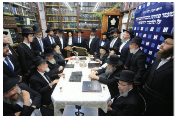
מעמד פתיחת לימוד דף היום בירושלמי במעונו של הרב זצוק"ל.

במעמד השתתפו ראשי ארגון 'דרשו' שפתחו מבחן חדשי מיוחד בהספק הלימוד בדף היום בירושלמי, אשר הלומדים בו ועומדים בהצלחה בכור המבחן זכאים לקבלת מילגה חודשית לפי כללי 'דרשו'.