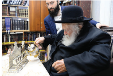
המשך בעמוד 4