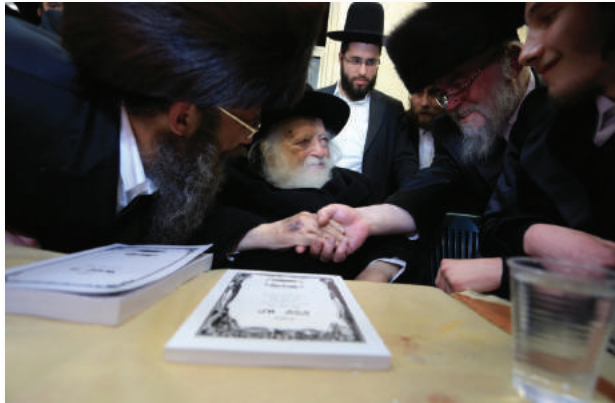
יש לי עבודה בשבילך, האם תסכים לכך? רבינו בשמחת משפחתו של הגרמ"ש שליט"א, כאת הכרת הטוב, יחד עם אביו הגרמ"מ גרליץ זצוק"ל.

"להגדיל תורה ולהאדירה, מיני ומנייהו יתרווח שמעתתא" - היתה שירת חייו, מבשרי אחזה, כל מי שפנה אליו שרוצה לההדיר את אחד מספריו, נתן לו רשות והורמנא, לא פעם אחת עמדתי על ימינו לשטנו, שלא יתן להם רשות באשר זה ימעט את הקונים של ספריו, אך לא הועיל לי, נפשו באחת ומי ישיבנה, "הן זוהי הרבצת תורה, אדרבא יגדיל תורה ויאדיר" היה אומר. המושגים "זכויות יוצרים", "כל הזכויות שמורות" לא היו קיימים לגביו.