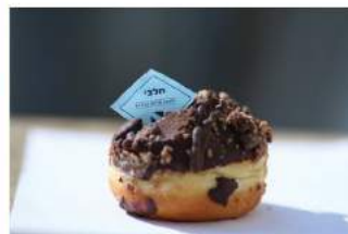
דגלון כחול בסימון 'חלבי'

וכתב הדרכי משה (ס"ק א), בשם הארוך (כלל מ דין יט), שכך