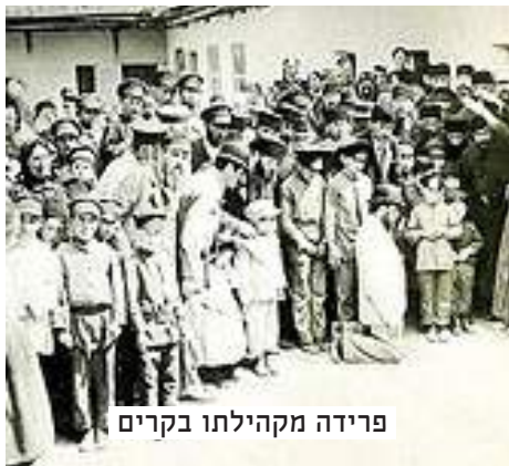
פרידה מקהילתו בקרים

ואכן התמסר להעמיד הדת על תילה בקרב הקרימנצ'ורים שהיתה יהודותם משובשת מחמת בורות וניתוק. תחילת מעשהו היה לוודא בלבנות