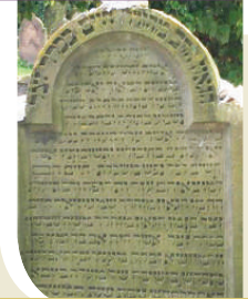
מצבת בעל החות יאיר בבית העלמין בוורמזא