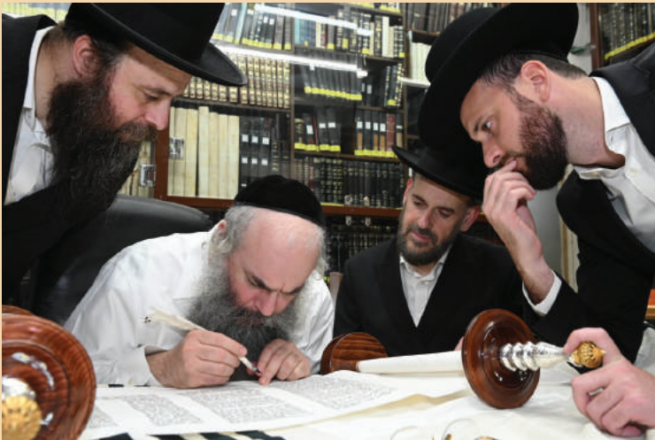
הגר"ש קניבסקי שליט"א בסיום כתיבת אותיות לספר התורה שהונס לבית החולים הדסה

מראות הוד משולחנו של הרב זצוק"ל בימים אלה