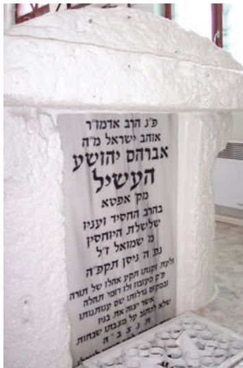
מצבת קדשו של בעל האוהב ישראל' במוז'בוז'

הדרך חזרה היתה קשה ורצופת מכשולים וסכנות, ובמהלכה תעה הסוחר בדרך ולא הצליח למצא מוצא. מזונו אזל, והוא סובב על פני השממה בדאגה מפני המות שעשוי לפוקדו בקרוב... אלא