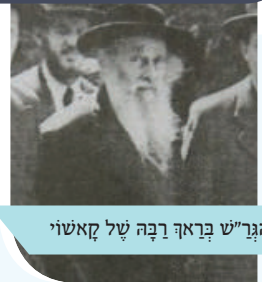
הגר"ש בראף רבה של קאשוי