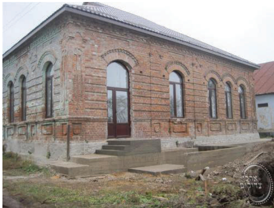
בית מדרשו של בעל האוהב ישראל' מאפטא