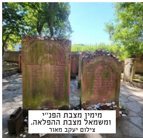
מימין מצבת הפנ"י ומשמאל מצבת ההפלאה.