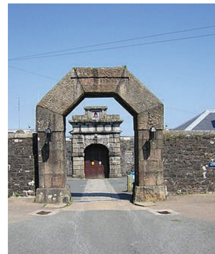
השער הראשי של בית הפלא דרטמור באנגליה

בלילה ההוא נדהה שנת השופט שטפל בתיקו של ר' יהודה. השופט התקשה לקבל את החלטתם של חבר המשפטים, לדידו לא היה עניש פה כבד על העברה שבצע ר' יהודה. באותו הלילה הוא התחבט בדבר, ובבוקר הוא החליט להתקשר מיזמתו לעורך הדין שיצג אותו, ואמר לו שברצונו לשבת ולעזוב בפקס הדין.