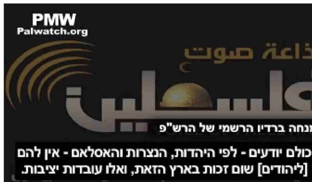
מול תעמולת השקר. ככה בונים תודעת שנאה

מה אנחנו עושים כדי לבצר את התודעה העצמית שלנו. את הצדק שלנו. את זכותנו המלאה בארץ הזאת. את היותנו רחמנים בני רחמנים