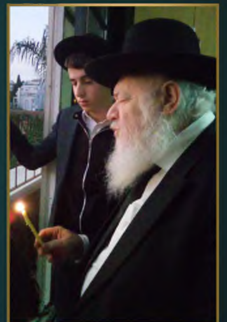
מדן הגר"א קוק