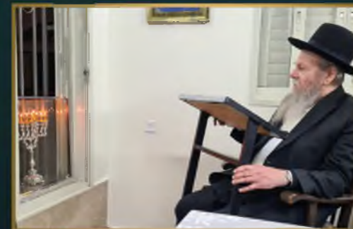
מדן הגר"מ"ש אדלשטיין