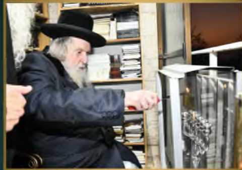
מדן פוסק הדור הגר"מ שטרנבוך