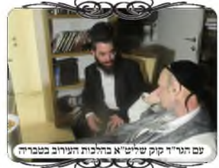
עם הנה"ו קוק שליט"א בהלכות העירוב בטבריה

לקראת השלמת העירוב, נכנסנו אל הגאון הצדיק רבי דב קוק שליט"א, המאציל ברוח על השכונה, ובישרנו לו על השלמת העירוב. הרב הראה שמחה גדולה מאוד, שכידוע ענין העירוב נוגע מאוד לליבו, וביקש לשמוע איזה רחובות הכניסו בעירוב, והאם נזרנו לא לכלול את הרחוב הראשי [אהל יעקב, אלחדיף] שיש בו חשש יותר גדול לרשות הרבים, כי הוא משמש גם כביש בין עירוני ומעבר לישובי הצפון [כביש 77].