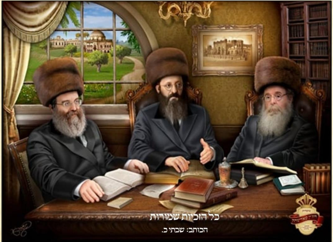
כל הזכויות שמורות הכותב: שכתוב.

א חוץ די גרויסע געפאראכטן צום רוזשינער, פון די המון עם אידן וועלכע זענען זיך געקומען מסתופף זיין בצילו, בעצה ותושי', זענען רוב צדיקי בדורו כסדר געקומען צופארן צוזעהן די געוואלדיגע מורא'דיגע עבודה והתנהגות בעבודת ה', ווי אזעלכע מדריגות וענינים בעבודת ה' האט מען גאר זעלטן געזעהן. ווי דער הייליגער בעל אוהב ישראל מאפטא זי"ע האט זיך אויסגעדריקט אויפן רוזינער, נאך ווען דער רוזשינער איז געווען גאר א יונגערמאן, זאגענדיג: איך ווייס אז דער יונגערמאן וועט אויסוואקסן א קדוש אין זיינע מעשים בלתי לה' לכוון.