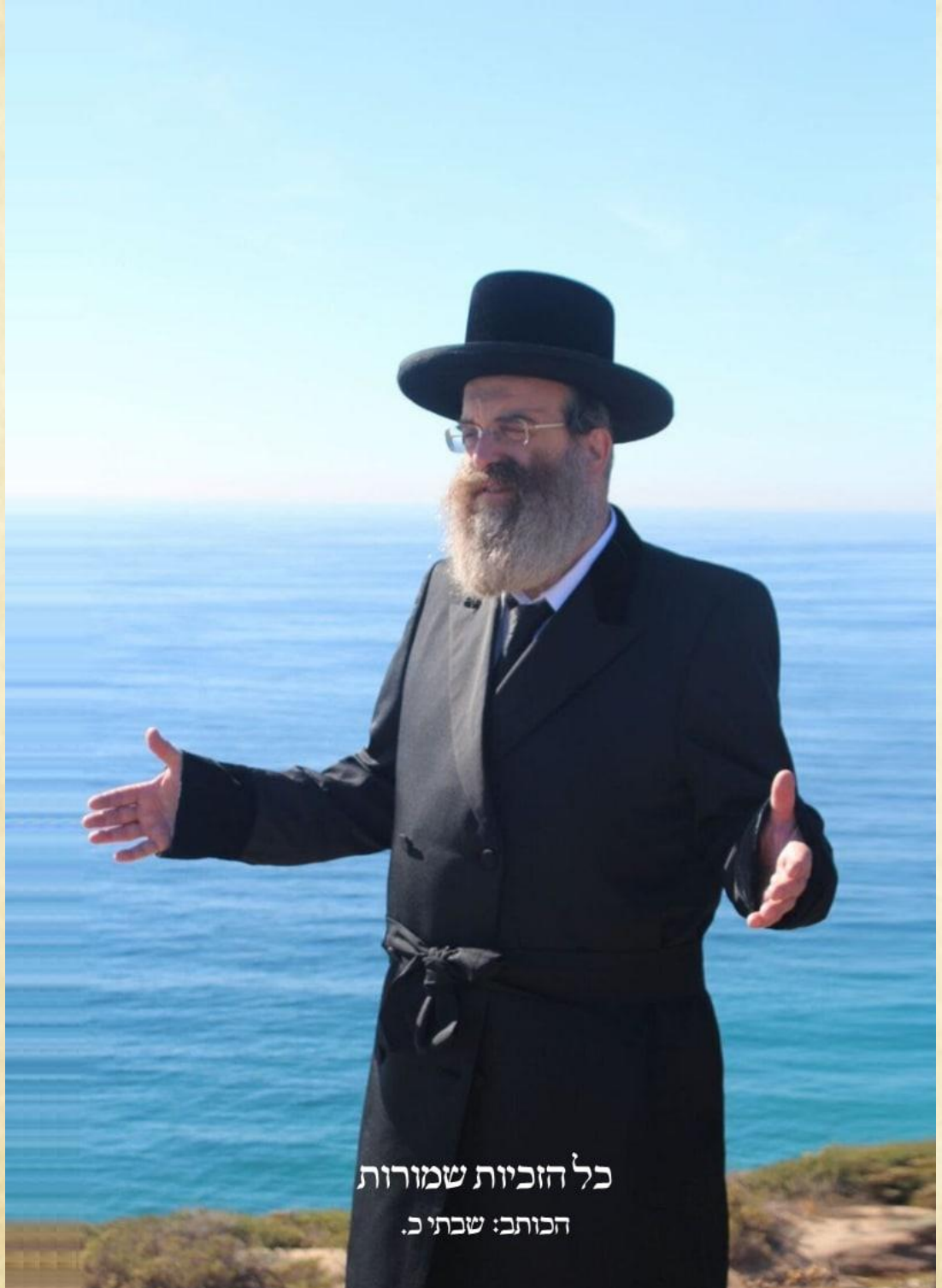
כל הזכויות שמורות הכותב: שבתו כ.

די רביצין האט מזראגעהאט אז איר בריוו וועל די רוסיין טרעפן, האט זי געשריבן אז 'אויב ווילסטו נישט, מוז ער נישט', איז רק אל צרפת או אונגליה. עס איז גאנץ מעגליך אז דער הייליגע רודשינער וואלט ווען געפאלגט זיין ווייב, און ער וואלט אנטלאפן קיין ענגלאנד אדער פראנקרייך. אבער ווי עס שטייט אין פסוק: "הנה לא ינום ולא יישן שומר ישראל" דער השי"ת פון "ישראל" שלומערט נישט און שלאפט נישט. דא איז געשעהן א נס מן השמים. אבער טאקע אן אמת'ער נס.