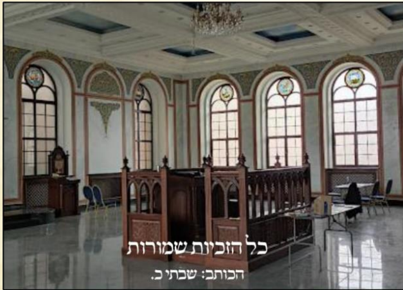
כל הזכויות שמורות הכותב: שבת ב.

כוונות, אבער דער הייליגער רוזשינער האט שוין נישט אויפגעבויט דעם שול בחייו, נאר דאס האט שוין געבויט זיין הייליג זוהן, דער אלטער סאדיגור'ער רבי. דער הייליגער רוזשינער האט אין יענע תקופה אנגעהויבן עפענען פיל מיט רוזשינ'ע קלויזן - שטיבלעך