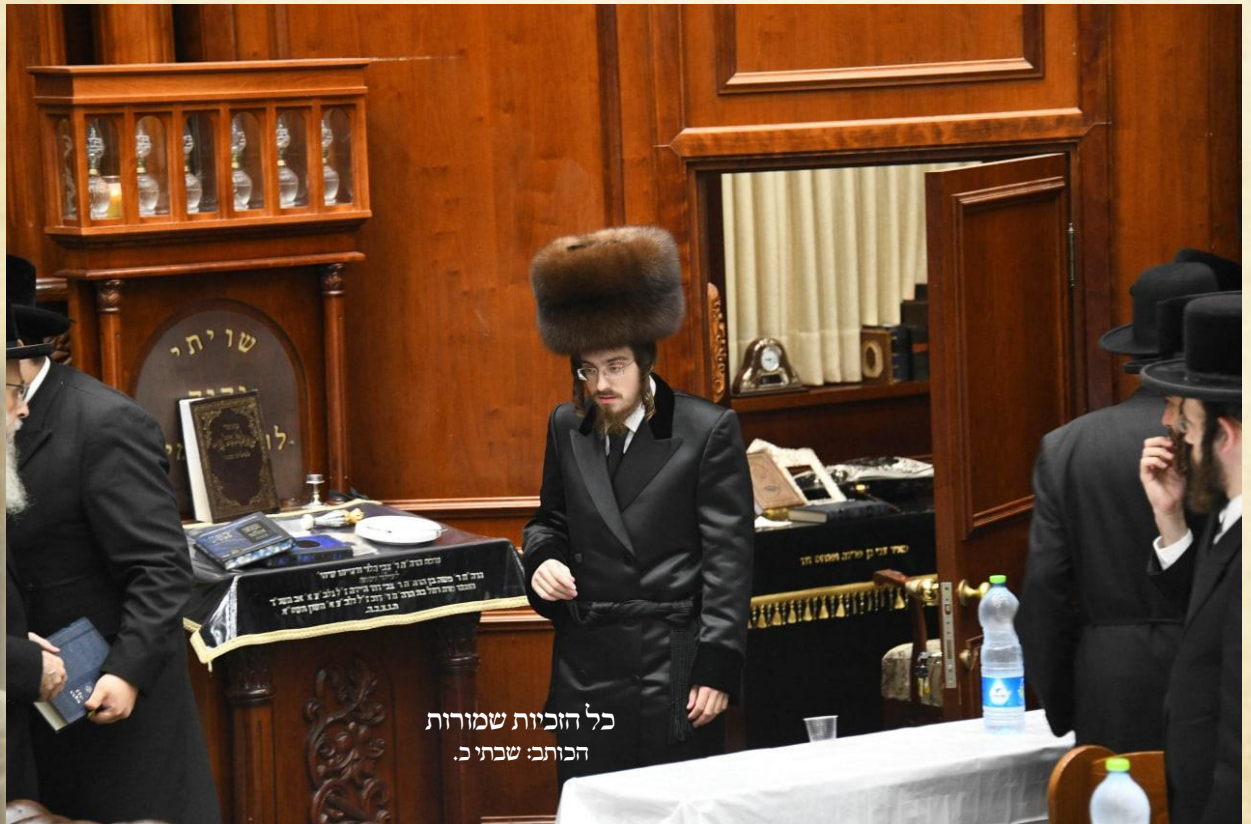
כל הזכויות שמורות הכותב: שבתאי כ.