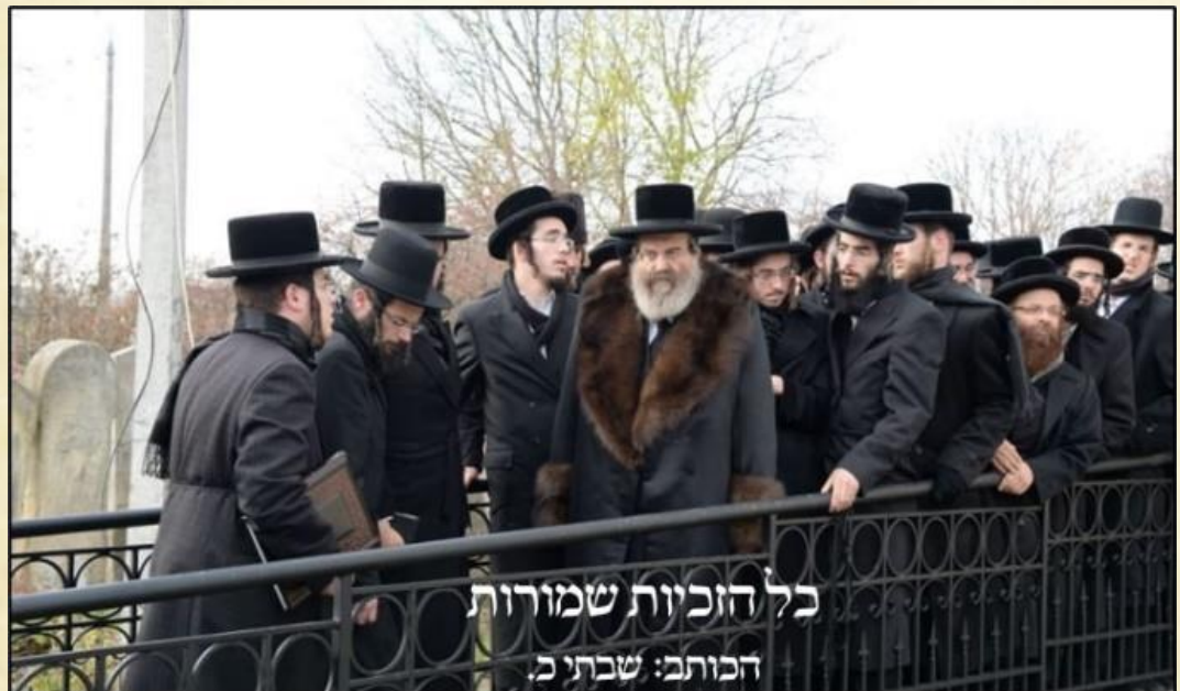
כל הזכויות שמורות הכותב: שבתי ב.

אויסער אמונה האט דער רוזשינער זיך אויסגעצייכנט אין עבודת השמחה און אין אהסת חברים. ווייל נאר אזוי, מיט שמחה און אהסת חברים קען מען שטייגן אין אמונה אינעם בורא כל עולמים און אין אמונת צדיקים. שמחה איז אין רוזשין געווען אויף א מורא'דיגער פארנעם, ווי שוין פריער דערמאנט, ווי מען איז נאר געפארן זענען מיט געקומען שפילער'ס וואס האבן געשפילט א נאנצער וועג. דער הייליגער רבי, דער עטרת ישראל זצ"ל פלעגט אלס ארומרעדן איבער דעם, אז מען דארף האבן א געשמאק אין יעדן מצוה. אבער וויאזוי קומט מען אן צו דעם? האט ער געזאגט, אז דער הייליגער זיידע דער רוזשינער זי"ע פלעגט זאגן: אז ביי יעדע מצוה דארף מען צוגיין מיט צוויי וועגן. 'חוקה היא ואין לך רשות להרהר אחריה. אבער נאכדעם דארף מען אויך וויסן 'מה טעם יש בה'. ווען מען ווייסט דעם טעם המצוה טוט מען דאס מיט גאר אן אנדערן געשמאק. ווען א בר מצוה בחור'ל פארשטייט פארוואס ער טוט אן תפילין, אז דאס איז נישט בלויז ווייל זיין טאטע טוט אזוי אן תפילין, נאר ער פארשטייט דעם עמקת פון וצונו להניח על היד לזכרון זרוע הנטוי, וכדו', אז מען פארשטייט די טעמי המצוות געבט עס דעם מענטש כלים זיך צו שטארקן קעגן די אלע נסיונות.