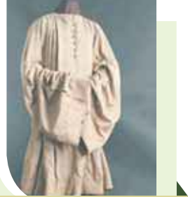
גלימתו של רבי שלמה מולכו, המצגת במוזאון היהודי בפראג

רבי שלמה מולכו נולד בפורטוגל בשנת ר"ס למשפחת אנוסים, כשלוש שנים לאחר המרת הדת הכפייה של יהודי פורטוגל. הוא חנך כגוי מבלי לדעת מאומה על יהודים ועל יהדות.