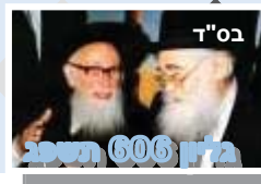
בס"ד דבר 606 תשס"ב