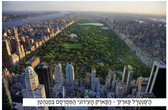
הסנטרל פארק - הפארק העירוני המפורסם במנהטן