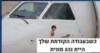
כשבבודה הקודמת שלך היית נהג מונית

כשאתה מלווה לחבר כסף ולא יודע איך להזכיר לו: - נו ה 100 שקל עזרו לך?