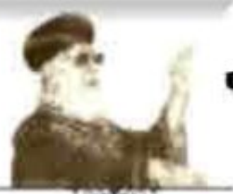
הרב עובדיה יוסף זצוק"ל