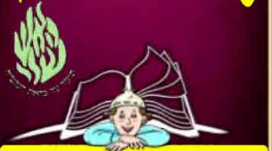
השמחה היא התרופה

גיבורים לעמוד בפרץ הגבורה הנסתרת כולנו מכירים את סיפור העקידה. גם בלי התבוננות יתירה וגם בלי להעמיק יותר מידי, רואים מיד שעקידת יצחק היא מסירות נפש בלתי נתפסת. המוכנות לוותר על כל היקר ואפילו על החיים רק בגלל שרצון ה' עומד מעל הכול. לא לחינם היא משמשת אות ומופת לדורות וסמל למסירות נפש והקרבה. בזכות ובכוח העקידה יהודים בכל הדורות מסרו נפשם על אמונתם ועל קיום התורה והמצוות. בפרשה שלנו אנחנו נתקלים בסיפור של מסירות נפש לא פחות מרשימה, ואולי אפילו הרבה יותר. אבל זה לא גלוי. זה לא צועק. צריכים התבוננות ולב מרגיש כדי לשמוע בסיפור את המשמעויות העמוקות והמטלטלות שלו: זמן קצר לאחר מתן תורה ולאחר אינסוף ניסים וחסדים – עם ישראל חוטאים בחטא החמור ביותר. כל אחד מאיתנו ששומע על חוטאים ופושעים שהורסים את העולם ועל כל מיני עוולות, מיד מתאזר ברגשות נקם ורוצה לראות את הפושעים באים על עונשם באופן נחרץ ומידי ומוקעים מהחברה ואפילו מתבערים לגמרי מן העולם. אבל משה רבינו רואה את הדברים בצורה אחרת לגמרי. הוא לא רואה כאן פושעים וחוטאים, אלא הוא רואה כאן בנים של ה'. בנים טועים, בנים שנמצאים בחושך, אבל בכל זאת בנים אהובים ויקרים. הוא אוהב אותם בכל לבו. והוא גם יודע בצורה הברורה ביותר שה' יתברך אוהב אותם בכל ליבו ולא רוצה במיתתם.