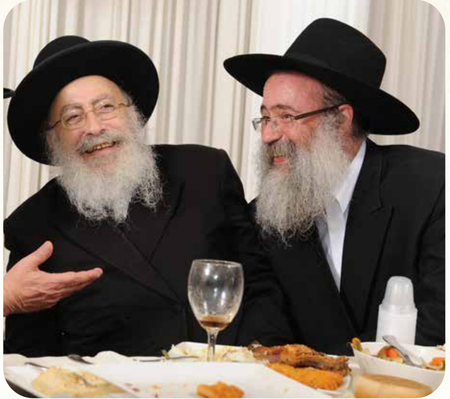
כל שיחה עמו הייתה לימוד. הגר"י שוויכה, יבלחט"א במחיצת חותנו, הגר"ש אליטוב זצ"ל

היחס שחז"ל דורשים "יהי כבוד תלמידך חביב עליך כשלך", הוא דבר שלמרבה הצער לא מובן מאליו כלל. ואצלו זה היה דבר פשוט. הדבר שאדם הכי זקוק לו זה יחס, כמו שדרשו חז"ל על הכתוב "גזלת העני בכתים", שהדבר היחיד שניתן לגזול מן העני זה במצב שהוא נותן לך שלום ואתה לא עונה לו. את היחס לאחרים הוא ידע לספק היטב.