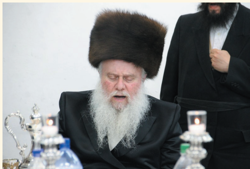
כ"ק האדמו"ר מואסלוי שליט"א בהילולת המגיד ממעזריטש זיע"א

לימים נתפרסם רבי דוב בער בתוארו 'המגיד ממעזריטש' והיה לממשיך דרכו וממלא מקומו של הבעל-שם-טוב בהנהגת תנועת החסידות כולה.