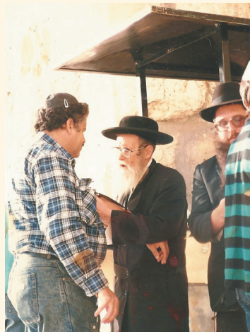
הגה"צ המשפיע רבי משה וובר זיע"א בדוכן התפילין ליד הכותל המערבי

אל דוכן התפילין שבכותל המערבי ניגשו שני בחורים, חזותם העידה שאינם מתושבי ארץ ישראל. בעברית עילגת ביקשו להניח תפילין. האברך שאייש את הדוכן, כבר קיפל את כל זוגות התפילין ונעל אותן במגירה. עכשיו הוא הביט בשעון, ראה שהשעה מאוחרת, ומאחר ואסור להניח תפילין אחרי השקיעה, ביקש לדחות את הבחורים ליום המחר. אך הם התעקשו וביקשו להניח תפילין עוד היום. מכיוון שנכחתי במקום, ביקשתי מהאברך שיוציא עבורם שני זוגות של תפילין, והוא ניאות לבקשתי.