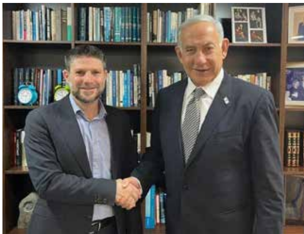
נתניהו וסמוטריץ.