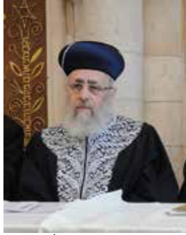
הרב יצחק יוסף.

זה 'ההוא', כהגדרת הרב יוסף? חכו. אם תהיתם, הרב הראשי הנוכחי גם יודע למה מתנכלים דווקא לו, והסביר: "כאשר מרן (אביו, הרב עובדיה יוסף זצ"ל) דיבר בזמנו נגד השופטים, אתם יודעים, דיבר עליהם מאוד חריף, אני לא יכול לחזור על זה, תבינו לכו... כשמרן דיבר על זה, אותו שופט הוא התרגז והתעצבן. עכשיו הוא מצא בעל חוב לגוב (לגבות) את חובו. יאללה, עכשיו אני אנקום בכן שלו. מרן נפטר. הכול נגיעות, הכול דברים כאלה. לכן לא היה צריך לענות לו". ועכשיו נפתור את חידת ה'ההוא'. כאן מעלה הרב הראשי הספרדי הסבר נוסף, אפשרי, למה מחפשים אותו. השד העדתי. "אחריי, הרב לאו (הרב הראשי