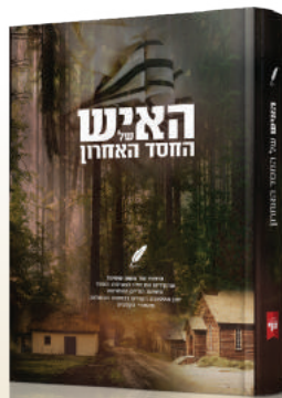
האיש של החסד האחרון