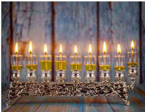
האור היהודי. המאבק על הזהות היהודית מול ההשפעות הזרות

היו שסברו כי אפשר ורצוי לספוג השפעות זרות, ולהשתלב במרחב ההלניסטי. מהר מאוד התברר כי זה פתח למסלול יציאה מעם ישראל