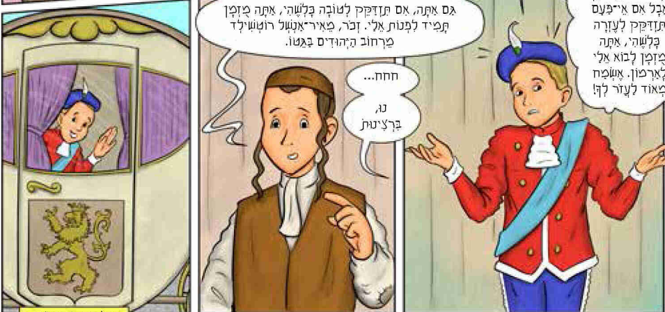
הכישוף יבוא איה