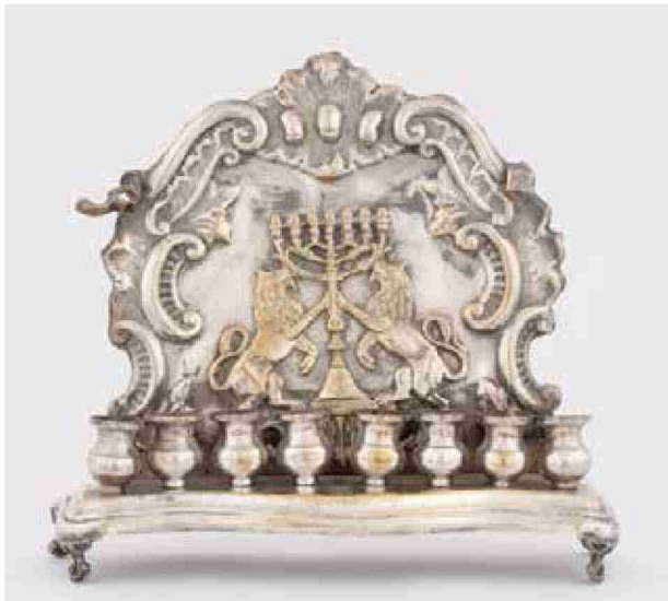
אחת החנוכיות שנבזזו בידי הנאצים בשואה.