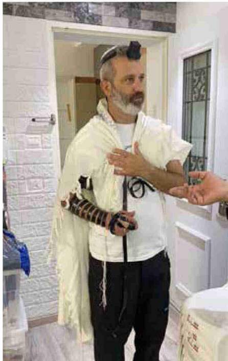
בכוח האמונה. "האמונה ליוותה אותנו"

דלת התא ואמרו לי שאני חופשי". המגעיים הדיפלומטיים הנמרצים בין המדינות הובילו לשחרור המיוחל.