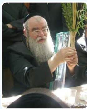
רבינו בעל הבן מלך בבדיקת ד' מינים מתוך שמחה של מצוה

(מתוך הפתיחה לשיעור נדרים דף כז, כ"ז חשון תשפ"ג)