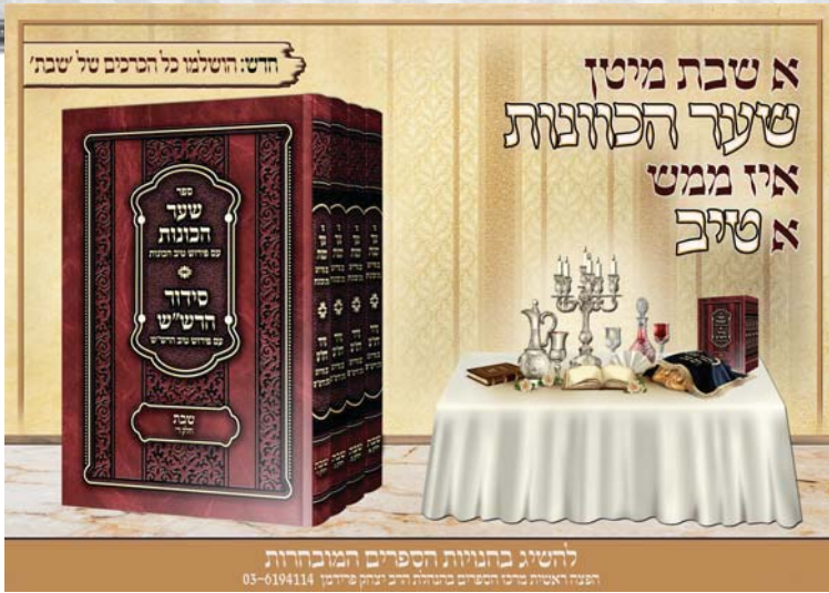
להשיג בחנויות הספרים המובחרות הפנה ראשית מיני הספרים במחיריהם הרגילים 05-0194114

מה שרואה ושומע בעולם, יוכל להבין ולהאזין את קריאת השי"ת אליו, מה נדרש ממנו ומה מבקשים ממנו בכל עת ובכל דבר. והוא רק צריך לפתוח את מוחו ואת ליבו להיות קשוב לכל המתרחש עימו, להבין את התכלית הנרצה בכל דבר, ולציית להוראות הנשלחים אליו בהשגחה פרטית מדוקדקת מן השמים. כאן עליך להיזהר ממכשול פלוני, כאן עליך לשנות את דרכך לפנות לדרך הטובה בימין ולהתרחק מן השמאל, בעוד כבודת ארץ מונח מכשול בדרך ועליך לעמוד בניסיון ולא להיכשל בו, וכדומה.