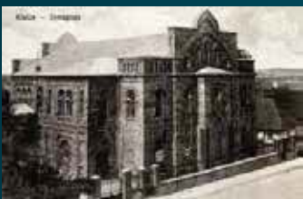
בית הכנסת קילצה בתקופת בין המלחמות