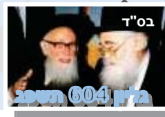
ב"ד רבנו הרב משה אריאל