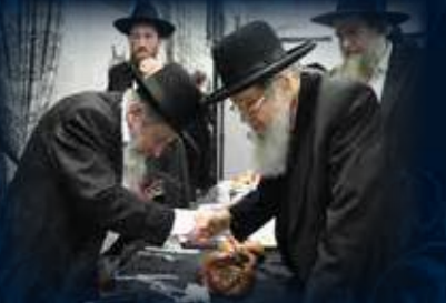
הגאון הגדול ר"ב ויסבקר שליט"א בשמחה