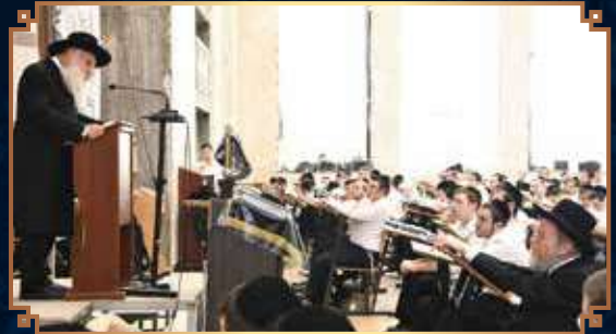
הגאון הגדול רבי דוד שוסטל שליט"א, מראשי ישיבת לייקווד, במשא חיוזק בהיכל ישיבת בית מדרש עליון