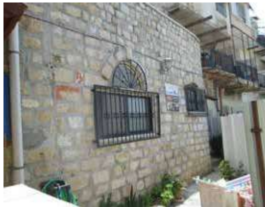
מעון-קדושו של הרה"ק בעל ה'באר מים חיים' מטשרנוביץ זי"ע"א

"כל האבנים ששימשו את ביתו וכאמור ניצבו כגל - לקחתים ואיתם בניתי את הקירות החיצוניים של הבית", מספר הרב חן. "האבנים שאני