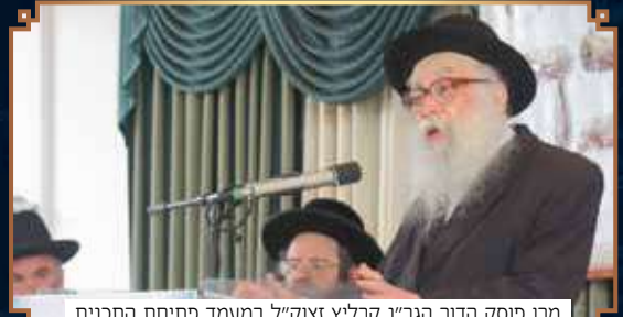
מרן פוסק הדור הגר"נ קרליץ זצוק"ל במעמד פתיחת התכנית