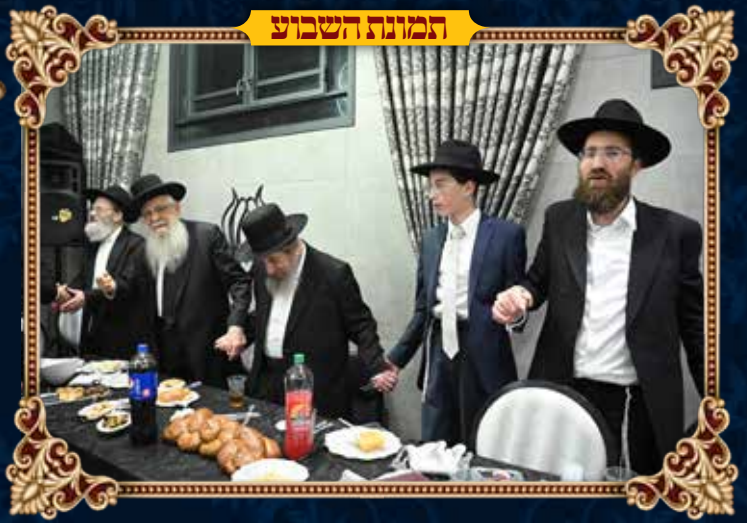
שמחת בר המצוה לנין מרן הגר"ד לנדו שליט"א