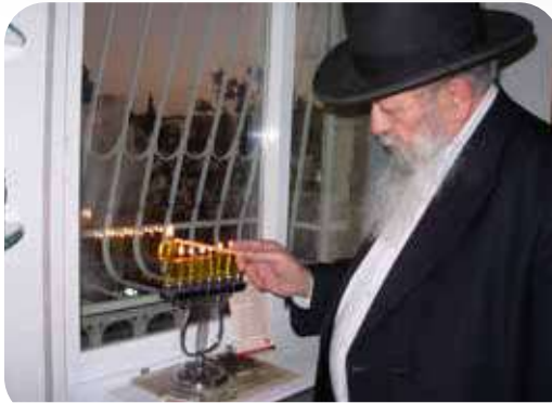
המשגיח הגר"א חדש בהדלקת נרות חנוכה

חנוכה צריך להביא כל אחד להתחזק במידת הביטחון בהקב"ה ובהנהגה הישרה, בעמל של רוח איש, לעלות מעלה מעלה, ואז נזכה לגאולה שלמה אמן ואמן.