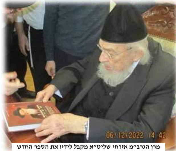
מרן הגרב"מ אזרחי שליט"א מקבל לידינו את הספר החדש

אנו במרחק של עשור מפטירתו של גאון התורה והמוסר, מרן המשגיח הגה"צ רבי גדליה אייזמן זצ"ל, ועוד שלושה עשורים נוספים מאז הצעד הדרמטי – שלא ידוע דוגמתו בדורנו – של פרישתו, בשיא כוחו ושנותיו, מתפקיד ההנהלה הרוחני של אחת הישיבות הגדולות והמפוארות בארץ-ישראל.