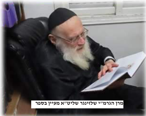
מרן הגר"י שליטי"א מעיין בספר

התבונה החינוכית שהשקיע נוגעת לא רק באשר ליחידים, אלא גם לכלל התלמידים.