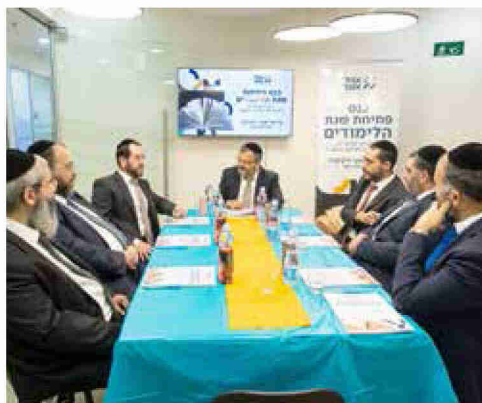
פתיחת שנה. למעלה משבע מאות תלמידים

"אתגרי הדור אינם דומים לאתגרי הדורות הקודמים. כיום נערים בעלי צרכים חינוכיים מיוחדים צריכים לקבל הנגשה מותאמת"