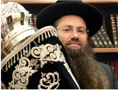
הרב יעקב הרצוג

אם הרבי שליט"א מלך המשיח מברך להצלחה בשליחות, בוודאי הוא גם רואה ברוח קודשו שיש בכל זאת את האפשרות להצליח לארגן מניין!