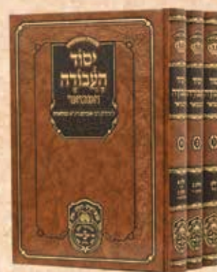
יסוד העבודה המבואר ג' כרכים