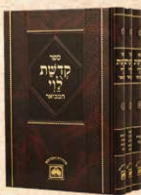
קדושת לוי המבואר ג' כרכים