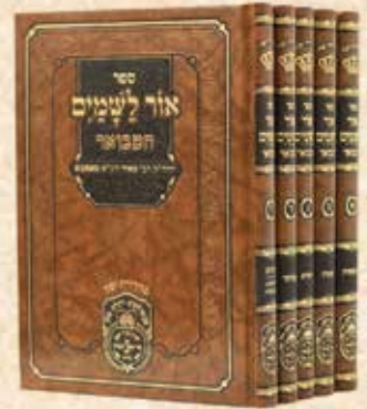
אור לשמים המבואר ה' כרכים