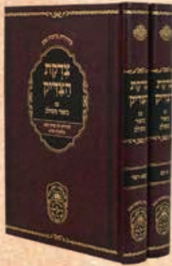
צדקת הצדיק עוז והדר ב' כרכים