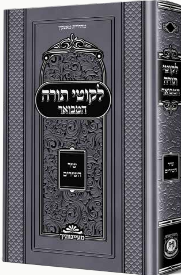
שער הספר החדש