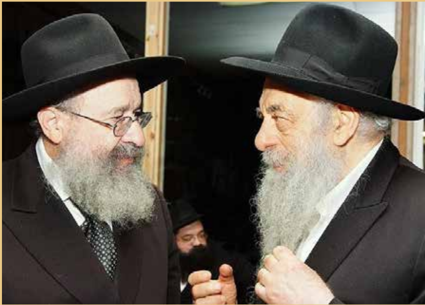
על האבניים. 'החזור' הגרי"ל כהן ויבלחט"א הגרי"ל שפירא בסוד שיח

לצד אלה, בריכוזים החרדיים בארץ הקודש יתקיימו התוועדויות עם הגרי"ל בימים שיקדמו ל'ט כסלו, בהשתתפות גדולי התורה והחסידות וציבור מבקשי ה'.