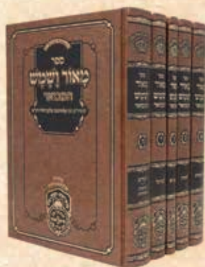
מאור ושמשי המבואר ה' כרכים