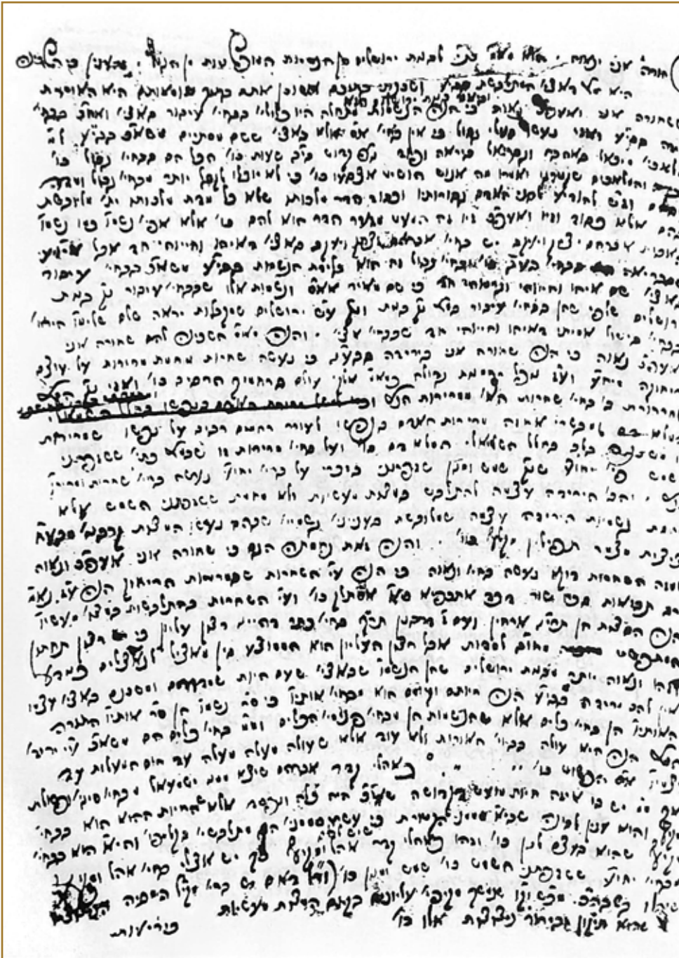
כת"ק אחיו של רבנו הזקן, הרה"ק מהרי"ל זי"ע, ובו המאמר ד"ה 'שחורה אני ונאווה' מ'לקוטי תורה' לשיר השירים

"אף פעם לא הצלחנו בפעם הראשונה והשניה לבאר את הכל. צריכים לעמול על כך, להתייגע, להתיישב וללבן את הדברים, ועדיין 'שגיאות מי יבין'. הרבה פעמים נזקקנו להכריע בין ביאורים שונים העולים מכמה גרסאות שיש לאותו מאמר. למשל, לפעמים בדרוש