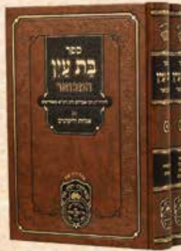
בת עין המבואר ב' כרכים