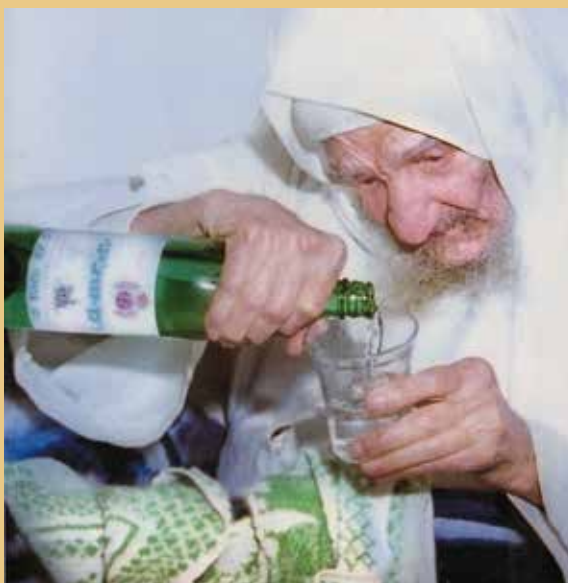
מדי שנה בחר לשהות בחודש אלול ובימים הנוראים בין כותלי ישיבת 'תומכי תמימים' בברינאוה. בבא סאלי זי"ע

לא עברו שנים רבות מאז הקמת הישיבה בברינאוה ככת היוצר לתורה וחסידות באירופה, עד שהוטל על ראשיה תפקיד חינוכי-רוחני חדש ומפתיע. באותן שנים התחוללו תהפוכות מדיניות במדינות אפריקה הסמוכות לצרפת, ומרוקן שהייתה עד אז תחת שלטון צרפתי הפכה לממלכה עצמאית. הדבר הוביל להגירה מסיבית ממרוקן לצרפת, כאשר בין המהגרים היו יהודים רבים שביקשו חיי נוחות ורווחה בצרפת, ובהם צעירים רבים שרצו להשתלם באקדמיה ולהבטיח את עתידם. בד בבד חוללו ארגונים יהודיים מודרניים כמו 'אליאנס' שמות במצבם הרוחני של היהודים במרוקן.