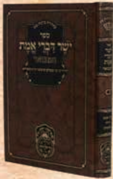
יושר דברי אמת המבואר