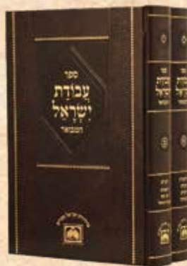
עבודת ישראל המבואר ב' כרכים