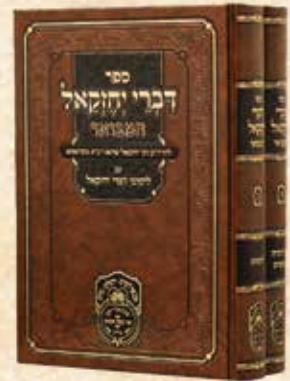
דברי יחזקאל המבואר ב' כרכים