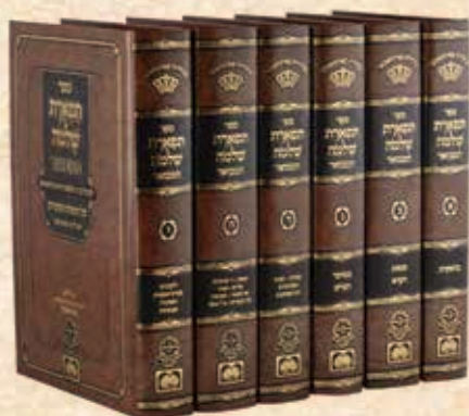
תפארת שלמה המבואר תורה ומועדים ו' כרכים