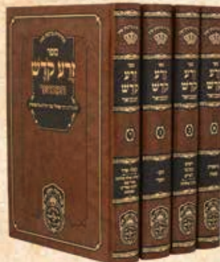
זרע קודש המבואר ד' כרכים