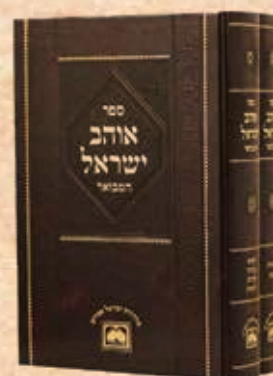
אוהב ישראל המבואר ב' כרכים

אלה ועוד 1,000 ספרים מחכים לכם ביריד ספרי החסידות בבנייני האומה