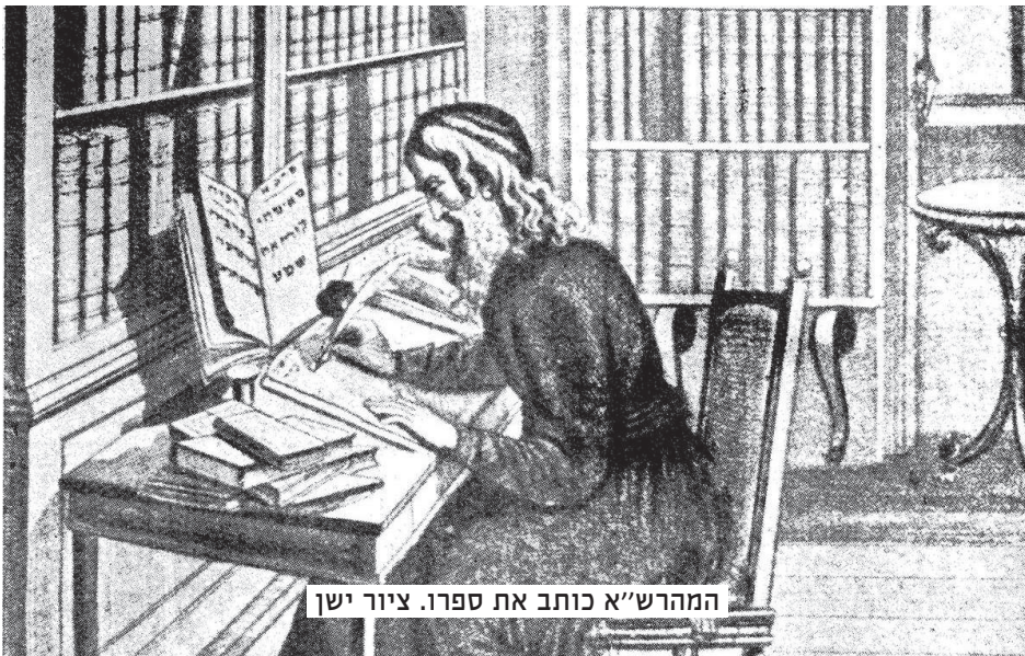
המהרש"א כותב את ספרו. ציור ישן