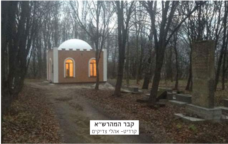
קבר המהרש"א

ממנו ית' ב"ה לא תצא הרע כי הוא הטוב הגמור ולא יתייחס הרע אליו אבל החטא גורם להביא הרע (ב"ק ס, ב).