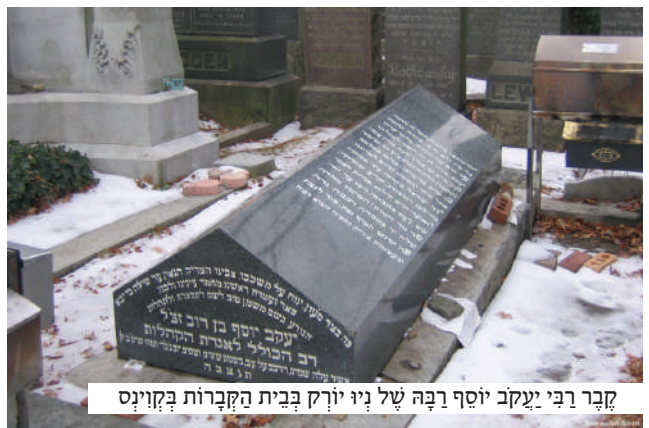
קבר רבי יעקב יוסף רבה של ניו יורק בבית הקברות בקווינס

בדרך לבית החיים בקווינס אל מקום קבורתו של הצדיק, לא יכלו שלא לחשב על צערה של אם החולה שכבר אבדה בת אחת, ועתה עמדה לאבד את השניה. למרות המצב המיאש הן החליטו להתפלל בכל לבן לפני הפל יכול, באמונה תמימה שכפי שבידו להחיות מתים ברחמים