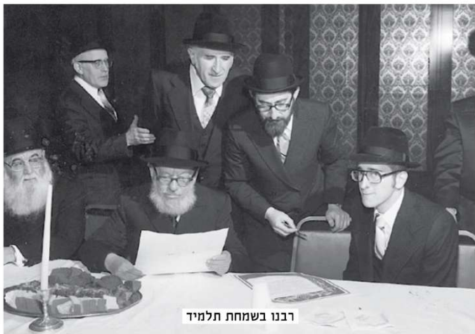
רבנו בשמחת תלמיד

את ידי העוסקים במלאכה, וטענו שהספר לא יהיה מובן דיו ללומדים. אולם היה זה ר' אליהו חזן שהמריץ אותם להוציא את הספר לאור, באומרו, שאם יהיה דבר מוקשה, הוא יבאר זאת כפי שזוכר ששמע מרבו. וסיים רבי אברהם ארלנגר: זכורני כאשר למדתי פרק כיצד הרגל והיה שם שטיקל 'ברכת שמואל' שהתקשיתי זמן רב בהבנתו. ובהיות שידעתי שרבי אלי' חזן הבטיח שיסייע בעד מי שיתקשה בהבנת הספר, סרתי אליו וביקשתי שיבאר לי דברותיו באותה סוגיא עמומה, ואכן הוא ביאר לי את דברי הברכת שמואל בטוב טעם ודעת, ואף הדפסתי זאת בספרי ברכת אברהם בשמו (ראה ברכת אברהם ב"ק מהדו' תנינא עמ' ז).