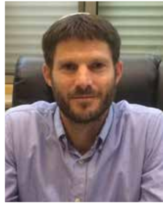
בצלאל סמוטריץ'.

"א מענטש טראַכט און גאַט לאַכט". בידיש, כמוכן, הבנתם? אדם מתכנן ואלוקים צוחק. פיניו ח'אן אל אחמר. כבר ארבע שנים שעתירה בעניין נדונה בבג"צ. בפעם האחרונה, השופטים אף הביעו מורת-רוח מדברי ב"כ המדינה ואמרו עליהם שהם סותרים עצמם מיניה וביה. ובכל זאת, בפברואר האחרון נעתר בג"צ, זו הפעם התשיעית