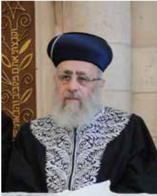
הרב יצחק יוסף.

ובעיניים שלי: לא רק שזו זכותם של פוליטיקאים להשתתף באזכרות (וכמובן לא לדבר שם פוליטיקה), ובכך לכבד את זכר הנופלים מזה ובני משפחותיהם מזה, אלא, שזו גם חובתם הציבורית. יציעו עליהם? לא נעים,