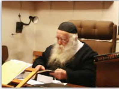
הגר"ח לומד עם משקפיים

ועי' בס' כל משאלותיך (מהגר"א מן שליט"א עמוד תע"ז) שנשאל רבינו זצ"ל עי' בן ישיבה, האם חובה להוריד את המשקפים ברחוב שלא לראות מראות אסורות, כאשר זה גורם לכאב ראש רציני, האם הורדת משקפיים זה חיוב מדין כמו דאיכא דרכא אחרינא אין זה חיוב ולא נחשב כדרכא אחרינא, והשיב רבינו זצ"ל, די לו שיחשוב בלימוד.