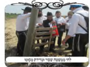
לחי ממשטה שבר ומדידת סקטור

לאחר חג הפסח נערך סיור ביישוב דתי שנמצא סמוך לפתח תקוה, שבחלקים מסוימים היו עמודים מסודרים וכשרים, אבל בחמשה מקומות היו עמודים פסולים ממש. החוט היה מהצד, הלחי לא היה במקום תחת החוט, והחבית היתה שקועה באדמה. האברכים ניסו ללמד זכות על המצב שגילו, ודנו אולי לפי שיטה כלשהי שאיננו פוסקים כמותה יהיה אפשרות להתיר את העירוב. הזכירו שיטות, הסבירו את ההכרעות, והתפללו לדמות דבר לדבר, אך למרבה הצער לא מצאו שיטה נכונה להכשירו.