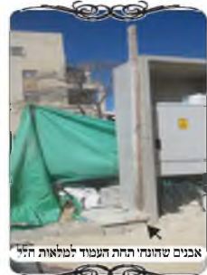
אבנים שיונתי תחת העמוד לטולאות חלי

אך עדיין יש מקום להסתפק, כיון שהוא לא השתמש באבנים סתם המצויות בקרקע, אלא בבלוקים שניכר עליהם שהם מיועדים לבנין, יתכן שדינם כמו חפצים, שבהם לא מועיל ביטול לשבת אחת. ועדיין הם כחפצים המונחים על הקרקע. אלא צריך לקחת אבנים שבורות, או אבני שפה של מדרכה, סוג שמיועד להחשב כקרקע. ואם לא ימצא אבנים כאלו, מומלץ עכ"פ לכסותם בחול, ובכך יחשב כקרקע. אבל בבלוקים גדולים צ"ע האם להקל שהם בטלים בצורה זמנית כל כך.