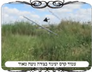
עמוד קרס ועמוד בצורה נוטה מאוד

עמוד קרס ונשאר עומד נטווי הרבה מהו שיעור העקמימות עוד הוספנו בימי בין הזמנים לנסוע עם תלמידים מהשיעורים לתקן עירובין בפועל. ביום חמישי האחרון נסענו עם שני אברכים למושב ה. ליד אשקלון, שאחד מהאברכים נהיה הבדק הקבוע של המושב ההוא, והוא נוסע מידי שבוע לבדוק אותו.