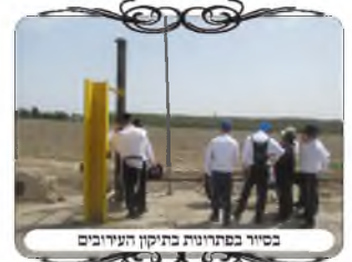
בסיור בפתח תקוה בתיקון העירובים

אך הדגשנו בשיעורים שכל זה כשידעיים לכוון את הלחי תחת החוט במדידה כשרה [בבקבוק או בפלס המיוחדים לזה], אבל בלי לכוון זה גרוע מאוד, כי יתכן שהעירוב פסול כמה שנים ואף אחד לא שם לב.