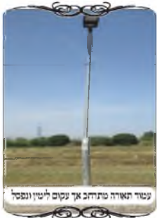
עמוד תאורה נפתח אך עקום לסיני ונסבל

התאורה הורו הרבנים שמתחשבים בחלק התחתון בפני עצמו, ואז החוט נמצא מעל כולו. וביארנו במק"א שהטעם כי רק שפת העמוד היא העמוד, ובעמוד תאורה גגול שבשפה של החלק התחתון אין המשך מעליו כלל, והחלק הממשיך בעמוד התאורה יותר זק, אינו המשך לחלק התחתון, ויוצא שהמשקוף מעל כל העמוד.]